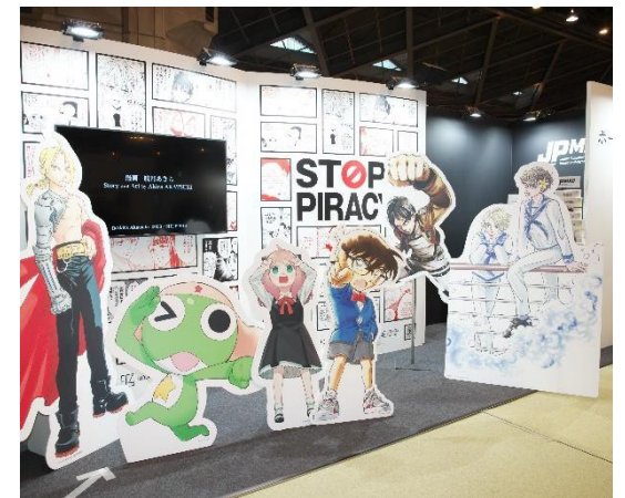
[上]鈴木総務大臣視察 [左]河野デジタル大臣視察 [右]ブース正面