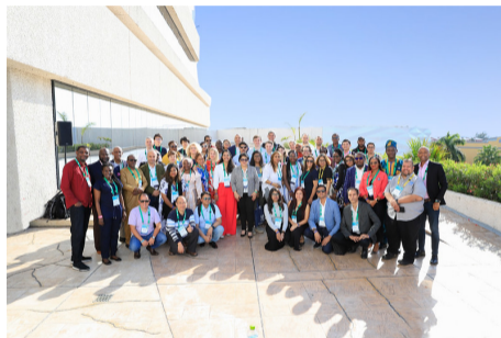
Figure: ICANN flickrより CC BY-SA 2.0