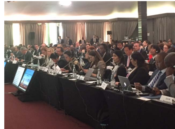
(右画像) ハイレベル政府会合の会場