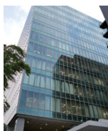
本社が入居するビル

会員企業紹介の取材で、東京都港区の株式会社KDDIウェブコミュニケーションズの本社を訪れました。