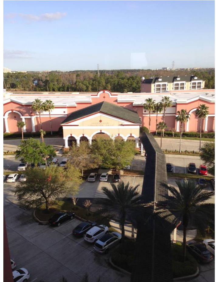
(Meeting Venue: Caribe Royale Orlando)