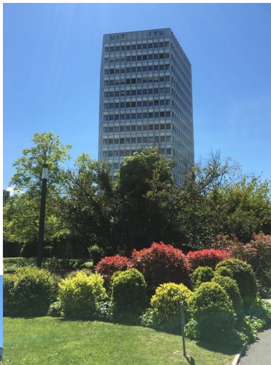
(国際電気通信連合 (ITU) 本部 : Tower Building)