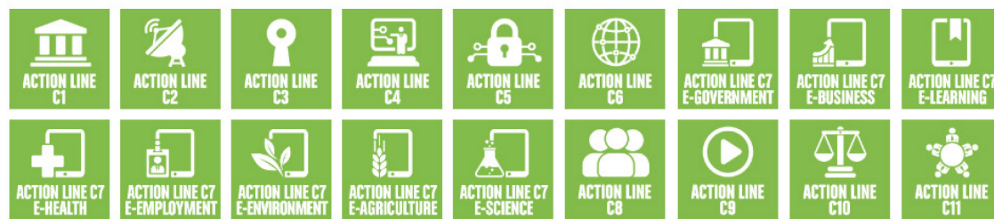
WSIS Action Lines